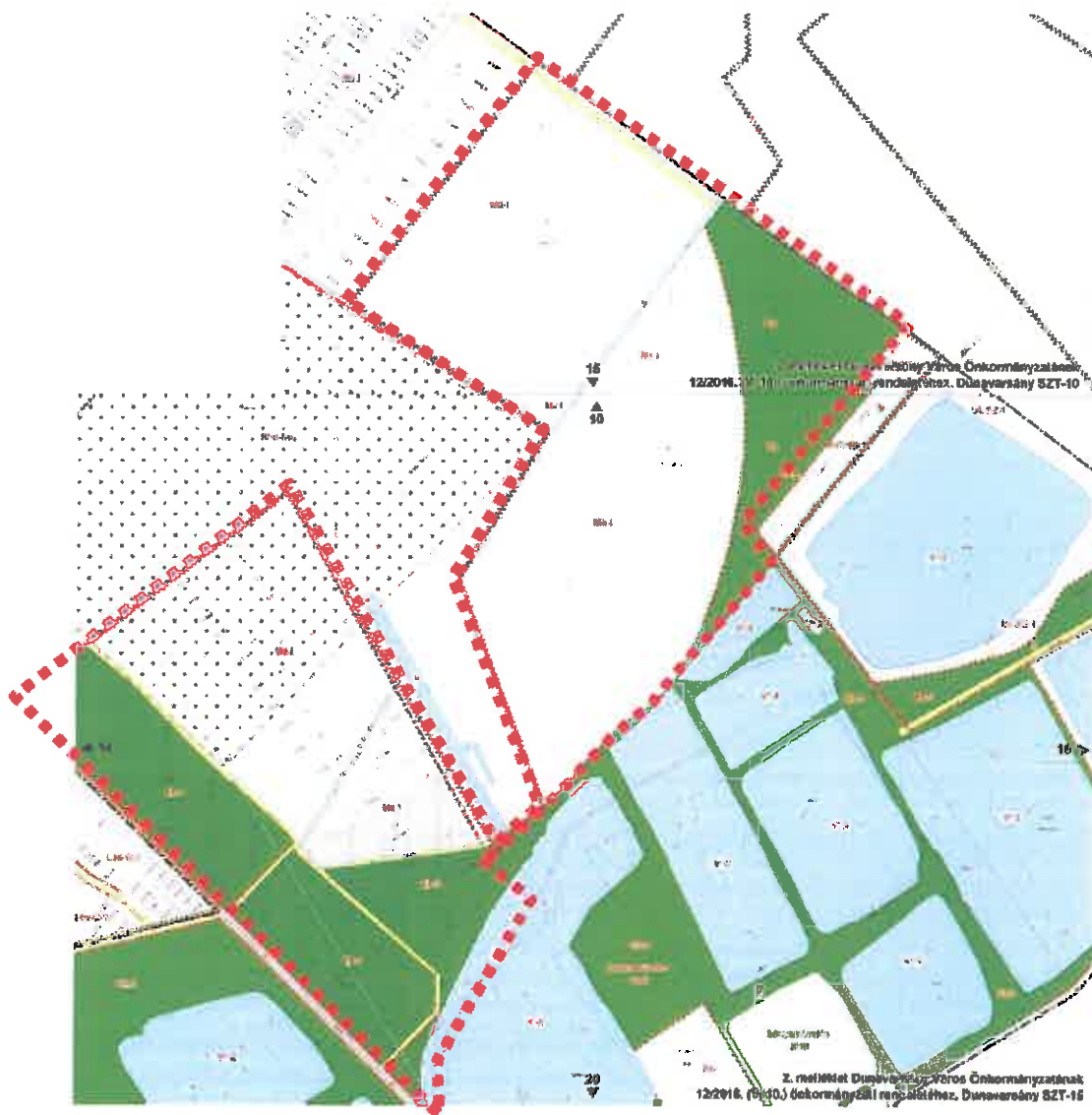
A Bugyi IX. - homok, kavics védnevű bányatelek Dunavarsány területén fekvő ingatlanjai Dunavarsány hatályos Szabályozási Tervén megjelölve